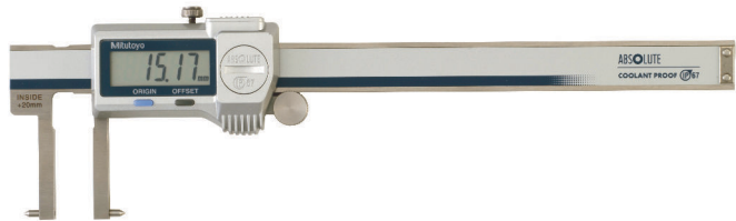
573-646-20 avec pointes de mesure intérieure